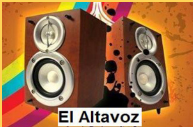
Logotipo del programa El Altavoz

El Boletín no se identifican necesariamente con las afirmaciones vertidas en los artículos que se publican bajo firma.