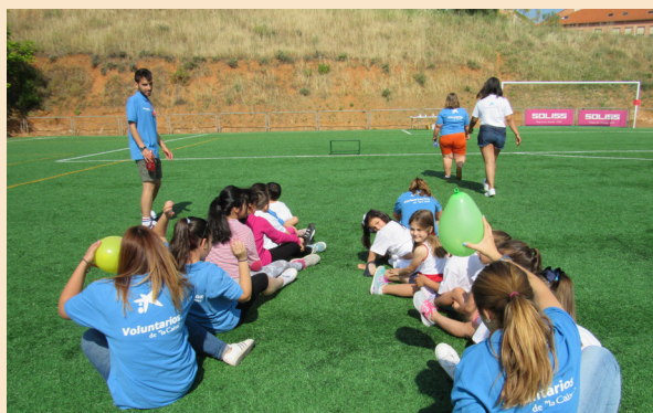
Cerca de 200 personas acudieron al Salto del Caballo para celebrar este Día del Voluntariado. Los monitores de CECAP Joven dinamizaron la jornada con una animada gymkana

El Grupo de Monitores de CECAP Joven ha participado de forma activa en el Día del Voluntariado de La Caixa celebrado en las instalaciones anexas al campo de fútbol del Salto del Caballo.