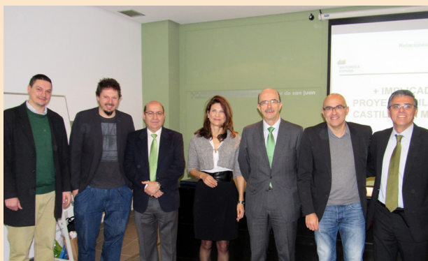
La Junta Directiva de la Fundación CIEES acudió a la presentación de "+ Implicados"