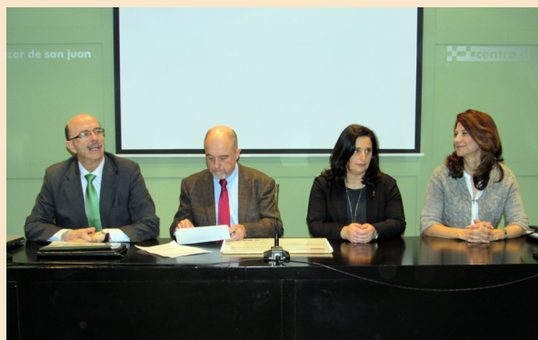
Imagen del acto formal de presentación de este proyecto impulsado por Iberdrola y la Junta

La Fundación CIEES participa en la iniciativa "+ Implicados" impulsada por Iberdrola y el Gobierno de Castilla-La Mancha para fomentar la innovación y el emprendimiento gerencial de los centros especiales de empleo en busca de nuevas oportunidades de negocio que posibiliten la generación de empleo de personas con especificidad.