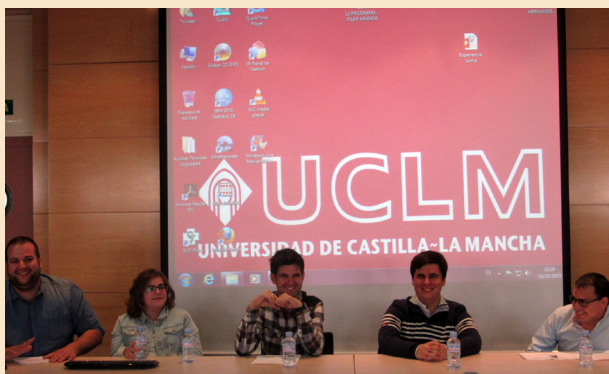
La mesa del empoderamiento personal de los participantes de CECAP fue la más destacada