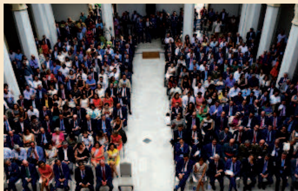
Una imagen general del acto de toma de posesión del presidente de la Junta de CLM