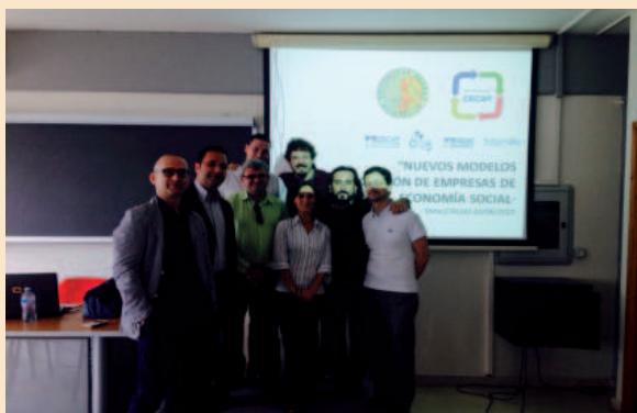
Imagen de grupo de la presencia de Grupo CECAP en la universidad Enna Kore