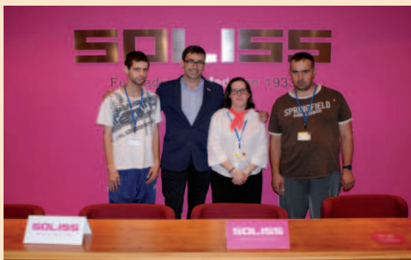
Algunos de los 40 jóvenes que disfrutarán de una beca de Futurempleo

La Fundación SOLISS ha puesto en marcha el programa Futurempleo, de formación laboral y mejora de la empleabilidad de personas con especificidad, por el que 40 jóvenes se formarán mediante una beca en puestos de trabajo normalizados en empresas privadas e instituciones colaboradoras.