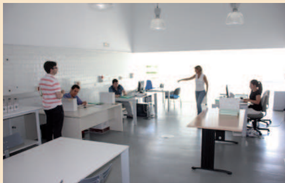
La oficina en la que realizarán su voluntariado formativo en el Archivo de CLM

Casi 50 personas se presentaron para cubrir esta oferta