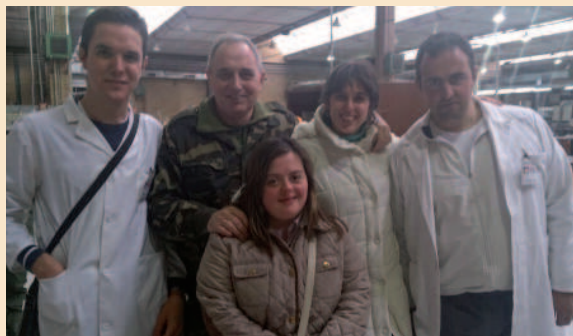
Jóvenes en proceso de voluntariado formativo en el CGET en Madrid

El Centro Geográfico del Ejército de Tierra en Madrid renovaba el pasado 9 de abril el convenio de colaboración con el grupo de entidades CECAP que permite la realización de prácticas a cuatro jóvenes en proceso de capacitación laboral.